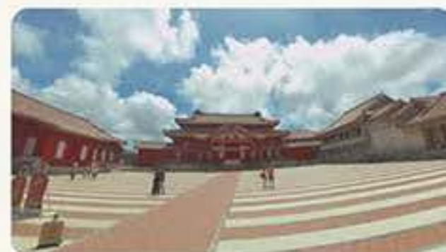
沖縄首里城さんぽ