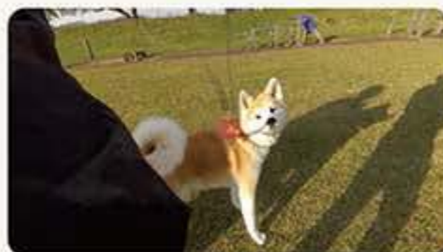
秋田犬との河川敷さんぽ