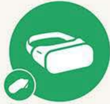
VRヘッドマウント &コントローラ