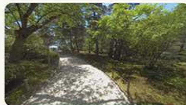
金沢兼六園さんぽ